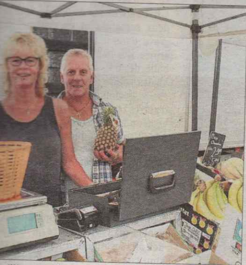
Marillier, vendeurs de fruits et légumes.

nés d'une forte aller ensemble. rs voisins de que, où ils ha- ent des repre-