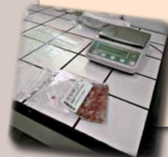
Échantillon de poisson