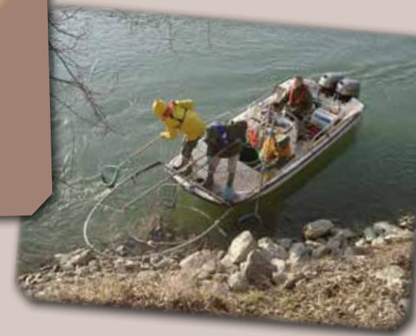
Pêche électrique sur le Rhône