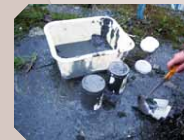
Prélèvement de sédiments