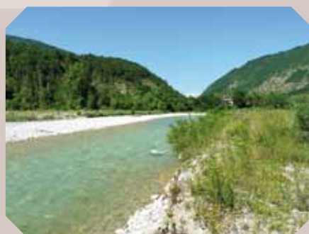
La Drôme à Ponet-et-Saint-Auban