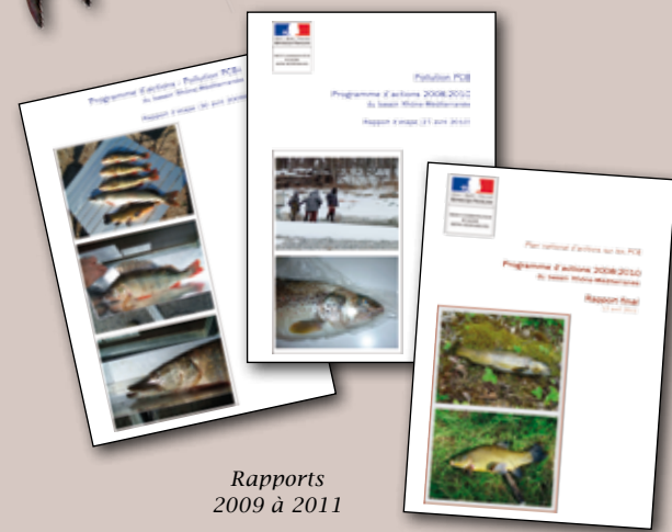
Rapports 2009 à 2011